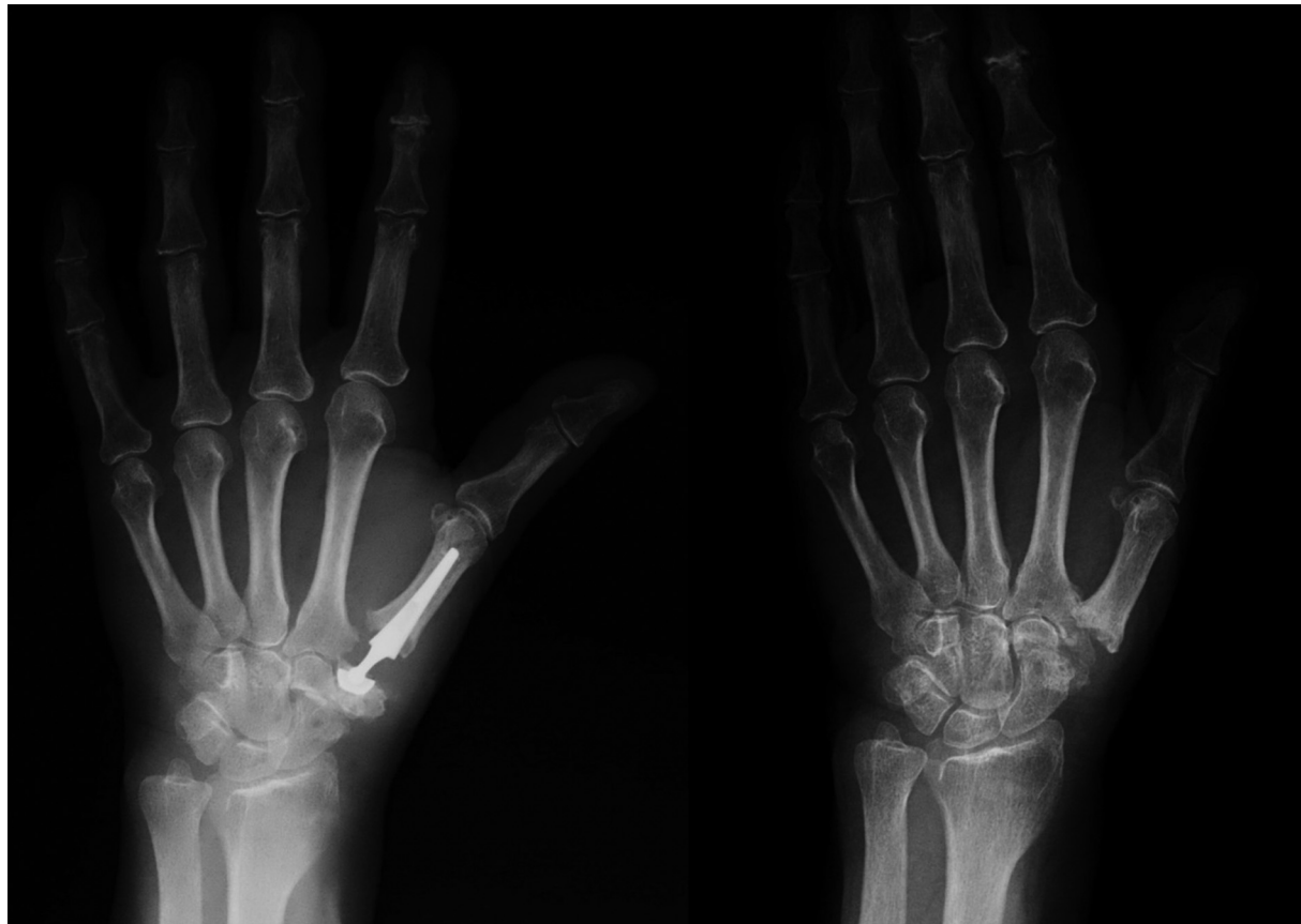
Fig. 6 Radiografía preoperatoria de un paciente con una prótesis dolorosa debido al aflojamiento de la copa del trapecio y radiografía a los 23 meses de seguimiento después de la extracción de la prótesis.

Se revisaron doce pacientes, cuyos datos se resumen en las ► Tablas 1 y 2 . La edad promedio de los pacientes en el momento de la cirugía fue de 61 años (rango 56-65). Once pacientes eran mujeres y uno era hombre. Se revisaron cuatro tipos diferentes de prótesis: 3 Arpe®, 4 Elektra®, 2 Ivory® y 3 Maia®. Ninguno de los pacientes con implantes Elektra® fue tratado inicialmente en nuestra institución. El tiempo promedio de supervivencia de la prótesis fue de 25,6 meses (rango 12-38), y el tiempo promedio de seguimiento después de la cirugía de revisión fue de 35,5 meses (rango 20-50). Dos casos fueron debidos a una luxación postraumática tardía y el resto de los casos se debieron a la movilización de la cúpula del trapecio. La puntuación promedio en la escala analógica visual (EVA) fue de 3,3 (IC del 95%: 1,8-4,7) con un rango de 1 a 8. El promedio del cuestionario Quick DASH fue de 48,6 (IC del 95%: 35,0-62,2). Se retiró el vástago metacarpiano en todos los pacientes. Se compararon las diferencias entre la fuerza de pinza y la fuerza de puño con el lado contralateral mediante el test de Wilcoxon. La fuerza promedio de pinza fue de 1,9 kg, lo que representa el 50% del lado contralateral, con un valor de p < 0,002 . La fuerza media de puño fue de 12,7 kg, que es el 71,3% del lado contralateral, con un valor de p < 0,0001 (► Tabla 2 ).