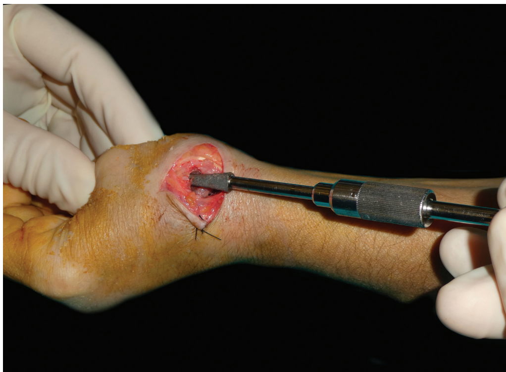
Fig. 5 Extracción del vástago metacarpiano mediante rotaciones repetidas del mango en T.