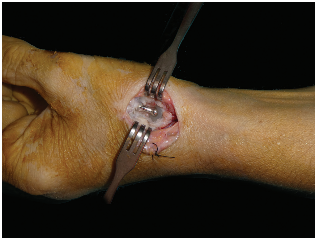
Fig. 1 Exposición de la prótesis mediante un abordaje dorsal.

Se realiza un abordaje dorsal en forma de "V" a nivel de la articulación TMC, con el vértice en la unión entre la piel palmar y dorsal. Se identifican y se protegen las ramas sensitivas del nervio radial y la arteria radial en la tabaquera anatómica. La articulación TMC se aborda entre los tendones de los músculos extensor largo y extensor corto del pulgar, a lo largo del eje del primer metacarpiano. A continuación se realiza una capsulotomía longitudinal y disección subperióstica de la base del primer metacarpiano y del trapecio, exponiendo el implante (► Figura 1 ). Es muy frecuente encontrar una pérdida de tejido capsular reemplazado por una gruesa cicatriz. Se recomienda preservar este tejido como cápsula, ya que proporciona cierto grado de estabilidad axial del metacarpiano al final del procedimiento. También es común observar la reabsorción ósea en la base del metacarpiano por puenteo de fuerzas (conocido en inglés como stress shielding ), como ocurre en otros implantes como el vástago de la prótesis de cabeza del radio o la prótesis de cúbito distal, 8 exponiendo completamente la parte proximal del vástago metacarpiano.