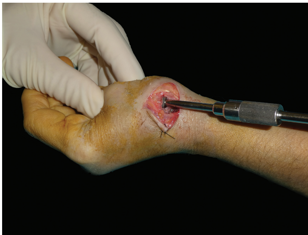
Fig. 3 La punta troncocónica del tornillo de extracción (2.4 o 2.5 mm) se engancha en la rosca interna del vástago y se conecta girando el mango en sentido contrario a las agujas del reloj.

Con movimientos rotatorios suaves y con la otra mano sosteniendo el pulgar a nivel del primer metacarpiano, la fuerza rotatoria rompe los puentes óseos que fijan el vástago y puede retirarse mediante tracción y giro en sentido contrario a las agujas del reloj (► Figura 4 y 5 ). Si este paso se dificulta debido a la integración del vástago, sostener el pulgar con la mano puede no ser suficiente para retirar el