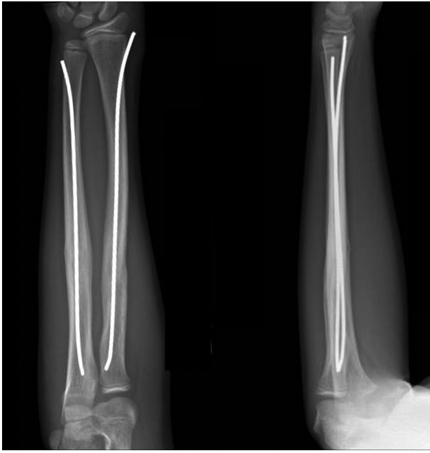
Fig. 2 Radiografia anteroposterior e em perfil aos 6 meses acompanhamento.

completa. As radiografias são obtidas em intervalos de 6 semanas para avaliação da consolidação e os pinos são normalmente removidos entre 9 e 12 meses (→ Fig. 2).