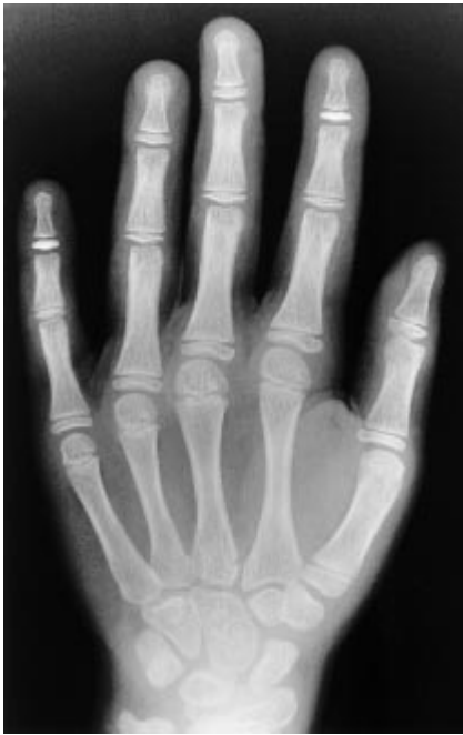
Abb. 3 Klassisches Bild einer Rachitis mit regulativem Hyperparathyreoidismus mit „gebecherten“ metakarpalen Epiphysenfugen. Die Kompakta der Akren ist dünn und aufgebessert, es besteht eine netzig-wabige Spongiosararifizierung.