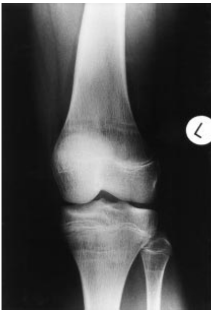
Abb. 4 In der Kontrolle 18 Monate nach Diagnosestellung und nach fortgesetzter Vitamin D-Substitution komplette knöcherne Durchbauung der ehemaligen Tumorregion und normale Konfiguration der Epiphysenfugen.

Kinder aus dem arabischen Kulturkreis auch in Nordeuropa ihre übliche Bekleidungsweise mit Einhüllen in lange Kleider und Tragen von Kopftüchern beibehalten, wird fast jegliche Sonnenbestrahlung der Haut verhindert und so die durch UV-Strahlung ausgelöste Umwandlung von 7-Dehydrocholesterol in stoffwechselaktives Cholecalciferol in der Haut unmöglich. Hinzu kommt noch eine verminderte orale Aufnahme von Vitamin D durch andere Ernährungsgewohnheiten. Durch den so entstandenen langanhaltenden Vitamin D-Mangel kann sich ein regulativer Hyperparathyreoidismus entwickeln, in dessen Folge schließlich auch braune Tumoren auftreten können.