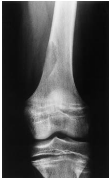
Abb. 1 Linkes Knie a.p. bei Vorstellung der Patientin: Scharf berandete Osteolyse an der medialen Femurmetaphyse mit lateralseitigem zarten Sklerosesaum, zusätzlich erweiterte Epiphysenfugen.

Aufgrund dieser Röntgenzeichen stellten wir die Diagnose eines braunen Tumors bei Rachitis mit regulativem Hyperparathyreoidismus. Zusätzlich angefertigte