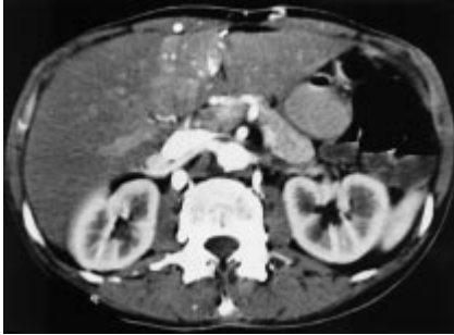
Abb. 4 Venae paraumbilicales im Ligamentum teres hepatis bei Verschluss der Vena cava superior.

der Thorax- und Bauchwand, hier bestand ein kräftiger Kollateralkreislauf über die Venae thoracicae internae, Venae epigastricae superiores und schließlich über die Venae paraumbilicales zur Vena portae. Im Segment 4a der Leber resultierte ein kräftiger Kontrastmittelstrom mit segmentalem Enhancement (Abb. 4).