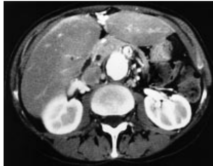
Abb. 1 Kräftige Gefäßkonvolute im Ligamentum falciforme hepatis bei Verschluss von Truncus coeliacus, Arteria mesenterica superior und inferior.

Eine auswärtig durchgeführte arterielle Angiographie der Aorta abdominalis und der Becken- sowie Beinarterien hatte einen Verschluss von Truncus coeliacus und Arteria mesenterica superior ergeben. Eine im Anschluss angefertigte Computertomographie des Abdomens wies einen Kontrastmittelfluss in Truncus coeliacus und Arteria mesenterica superior nach, bei offensichtlich stammnahem Verschluss beider Gefäße. Im Ligamentum teres hepatis sah man kontrastierte Gefäße, die bei fehlenden hepatischen Veränderungen und fehlenden Zeichen einer portalen Hypertension nicht einer rekanalisierten Vena umbilicalis entsprachen (Abb. 1). Darüber hinaus war an der ventralen Thoraxwand rechts eine kräftige Arteria thoracica interna nachweisbar.