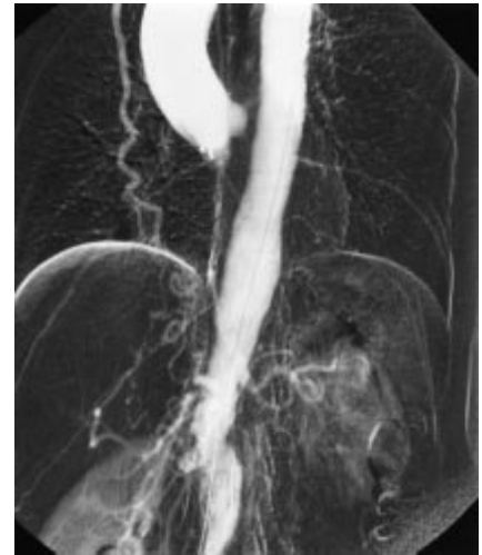
Abb. 2 Ausgeprägte rechtsseitige Arteria thoracica interna, die unterhalb des Zwerchfells in das Ligamentum falciforme der Leber eintritt und über zahlreiche kleine Gefäße retrograd den Truncus coeliacus füllt (Vergl. Abb. 1).

Bei einer 40-jährigen Patientin wurde im Rahmen der Tumornachsorge eines Oropharynxkarzinoms, welches mittels Tumorexzision, Neckdissection und Radiatio behandelt wurde, ein erhöhter CEA-Wert festgestellt. Die Überweisung