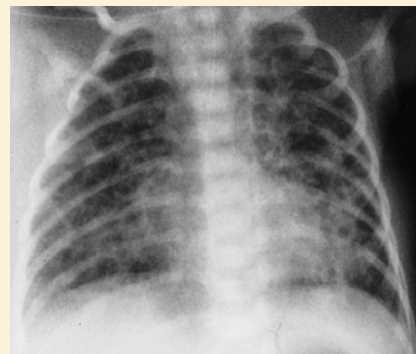
Abb. 1 Röntgen-Thorax am 3. Lebenstag in a.p.-Projektion: Grobnetzige, teils zystisch imponierende Zeichnungsvermehrung über beiden Lungenfeldern.

Aktueller Verlauf: Das Kind konnte mit einem Gewicht von 2400 g am 58. LT mit altersentsprechendem neurologischen Befund, Eupnoe, einer Sauerstoffsättigung von > 95% (transkutan) bei Raumluft und normwertiger BGA entlassen werden.