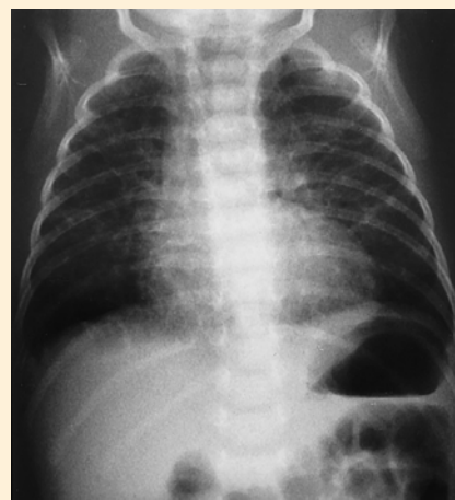
Abb. 2 Röntgen-Thorax am 49. Lebenstag in a.p.-Projektion: Interstitielle Herzzeichnung, im Verlauf diskret rückläufig.