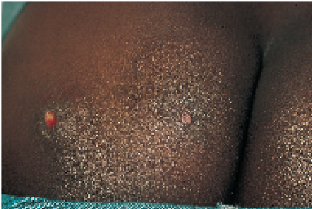
Abb. 1 Furunkuloide Veränderungen durch Larven der Tumbufliege am Gesäß eines 8-jährigen Mädchens aus Ghana.