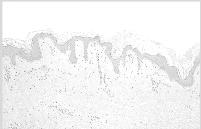
Abb. 2 Histologischer Befund: Epidermale Papillomatose mit milder Acanthose sowie Orthohyperkeratose.