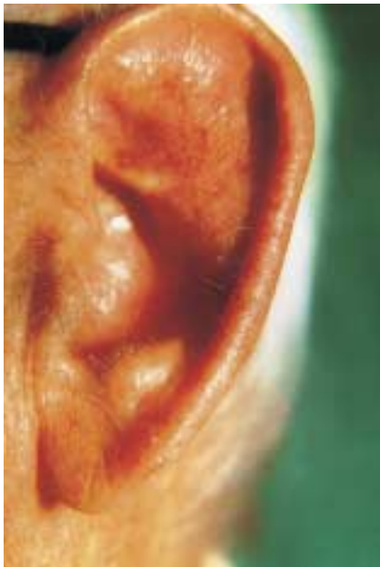
Abb. 3 Keratoakanthom. Komplette narbenfreie Abheilung 6 Wochen nach Therapiebeginn.