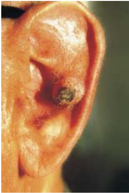
Abb. 1 Keratoakanthom. Tumor vor Beginn der topischen Imiquimodapplikation.