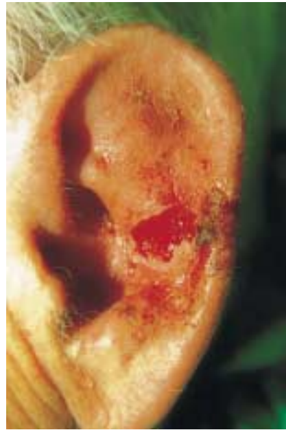
Abb. 2 Keratoakanthom. Tumor nach 4-wöchiger täglicher Therapie und Entfernung aus dem Tumorbett.