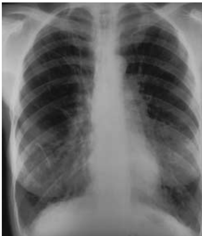
Abb. 1 Röntgen-Thorax bei LAM: retikuläre und streifige Verschattungen mit zystischen Veränderungen und Zeichen der Überblähung.