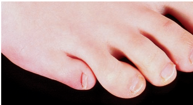
Abb. 3 Nach lateral gewendeter Kleinzehennagel kombiniert mit kurzer Kleinzehe. 35-j. Frau.

breitet war, dass sie nicht als Abweichung wahrgenommen wurde. An familiären Besonderheiten wurden aber offenbar sowohl die Verkürzung der Kleinzehe als auch die Lateralversion der Nägel als innerhalb der Spielbreite idealer Schönheit empfunden. Bei Kultbildern der Aphrodite hätte man sie sonst vermieden.