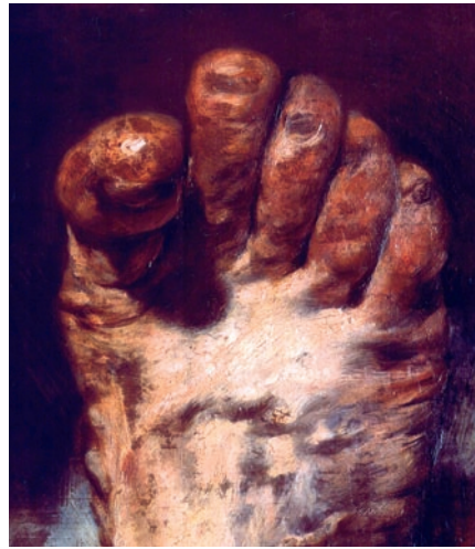
Abb. 4 Adolph Menzel: Der Fuß des Künstlers (Ausschnitt). Alte Nationalgalerie, Berlin.

Zugleich sind diese Darstellungen ein Indiz dafür, dass „Urmodelle“ antiker Kultstatuen und Weihgeschenke nach lebenden Modellen geschaffen worden sind. Darunter waren einzelne mit solchen