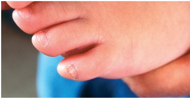
Abb. 2 Fuß eines 11 Monate alten Mädchens mit nach lateral gewendetem Kleinzehennagel.