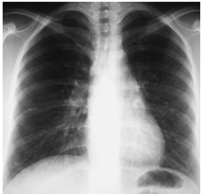
Abb. 2 Röntgen-Thorax pa: Feinretikuläre, teils milchglasartige Trübung der Lunge mit Betonung der Mittel- und Unterfelder.

Die Thoraxübersichtsaufnahme p.a. zeigte eine feinretikuläre, teils milchglasartige Trübung der Lunge mit Betonung der Mittel- und Unterfelder. Im HR-CT ließ sich eine generalisierte, zentrilobulär akzentuierte Milchglaszeichnung nachweisen (Abb. 2 und 3).