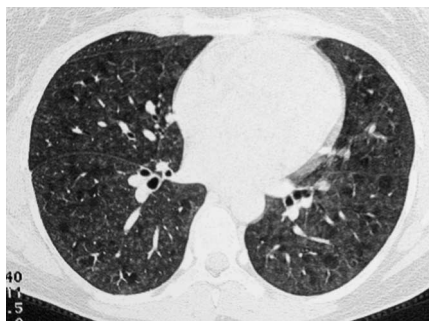
Abb.3 HR-CT des Thorax: Generalisierte Milchglaszeichnung, zentrilobulär akzentuiert, mit Aussparung einzelner sekundärer Lobuli (Mosaikperfusion).

Die bakteriologische und mykologische Untersuchung des Zimmerspringbrunnenwassers ergab Wachstum von Mucor species , Saccharomyces cerevisiae und Bacillus subtilis . Die Bestimmung der Endotoxinkonzentration im Zimmerspringbrunnenwasser mittels chromogen-kinetischen LAL-Tests, BioWhittaker, ergab mit 39 EU/ml, entsprechend 3,9 ng/ml einen niedrigen Wert.