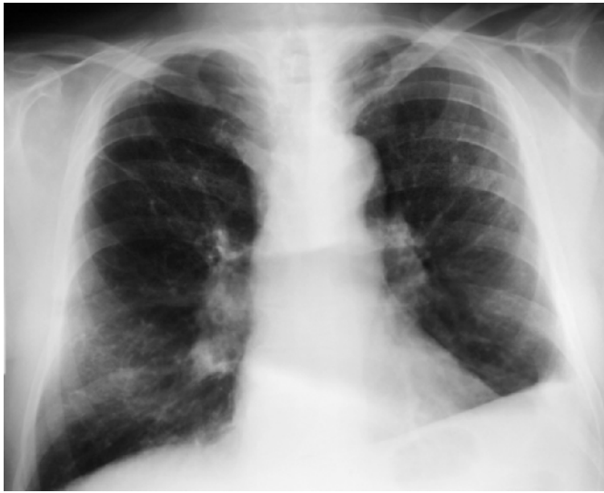
Abb. 1 Röntgenthoraxaufnahme vom Januar 2002.

Die Röntgenthoraxaufnahme p. a. vom Januar 2002 (Abb. 1) weist vorwiegend im Bereich der beiden Mittel- und Unterfelder eine feine bis mittelgrobe Fleckelung und Tüpfelung sowie eine streifig-netzförmig verstärkte Lungengrundzeichnung auf (ILO 2000 p/q 2/2, ax). Vereinzelt sind auch kleine induriert wirkende Fleckschatten im rechten Oberfeld, strangförmige Streifenzeichnung vom rechten oberen Hiluspol bis zur lateralen Thoraxwand ziehend nachweisbar. Die Lungenwurzeln sind beidseits betont. Das rechte Zwerchfell ist regelrecht gewölbt, medial etwas unscharf begrenzt. Der Zwerchfellrippenwinkel soweit einsehbar frei. Das linke Zwerchfell steigt nach lateral an, ist glatt begrenzt und mit der lateralen Thoraxwand breit adhären.