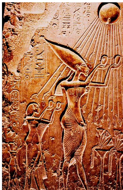
Abb. 1 Amarna-Kultur in Ägypten (1364–1348 v. Chr.). Menschen und Pflanzen empfangen die Leben spendenden Sonnenstrahlen und der Priester-König Echnaton huldigt dem allein herrschenden Sonnengott Aton.

Die Sonne wird denn auch im Mittelalter wiederholt in den Dienst der Lobpreisung Gottes gestellt. Franziskus von Assisi, der Gründer des Franziskaner-Ordens, besingt 1224 in seinem Sonnengesang ( Cantico di Frate Sole ) den Bruder Sonne und die Schwester Mond und beschwört beide, ihn in der Lobpreisung Gottes zu unterstützen. Ähnliches hat der Dominikaner-Mönch Tommaso Campanella 1602 ausgedrückt, als er im Gefängnis seinen utopischen Roman „ Città del Sole “ schrieb und einen idealisierten Sonnenstaat beschrieb.