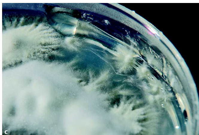
Abb. 1 Zoophiles Isolat von Trichophyton interdigitale (ehemals Trichophyton mentagrophytes ). 16-jährige Patientin mit Tinea faciei. a 10 Tage alte Subkultur auf Sabouraud 4%-Glukose-Agar. b Charakteristische gelb-braune, z. T. farblose Kolonierückseite. c Detailaufnahme der Kolonien mit zentral flauschiger Oberfläche, peripher teils granulär, teils ausstrahlend.

Mykose bzw. Tinea zugeordnet, so dass im Einzelfall erst verspätet antimykotisch behandelt werden kann.