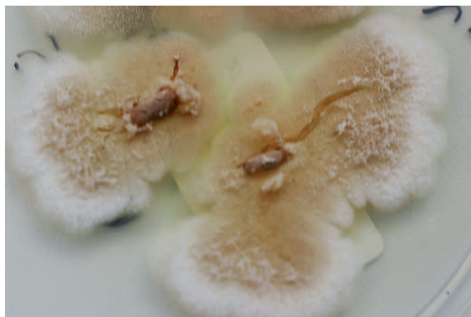
Abb. 2 Scopulariopsis brevicaulis

Candida ( C. ) krusei bzw. C. glabrata . Mittels biochemischer Reaktionen, z. B. der Assimilation von Zuckern, die für häufig auftretende Hefespezies einen charakteristischen Code ergeben, erfolgt weitere Speziesdifferenzierung. Diese ist unbedingt erforderlich, da es Hefen gibt, die gegen bestimmte Antimykotika resistent sind und apathogene Arten, wie z. B. Saccharomyces . Die häufigsten Hefen sind bei Dermatomykosen C. albicans , C. parapsilosis , C. guilliermondii , bei Schleimhautmykosen C. albicans , C. glabrata und C. krusei [10].