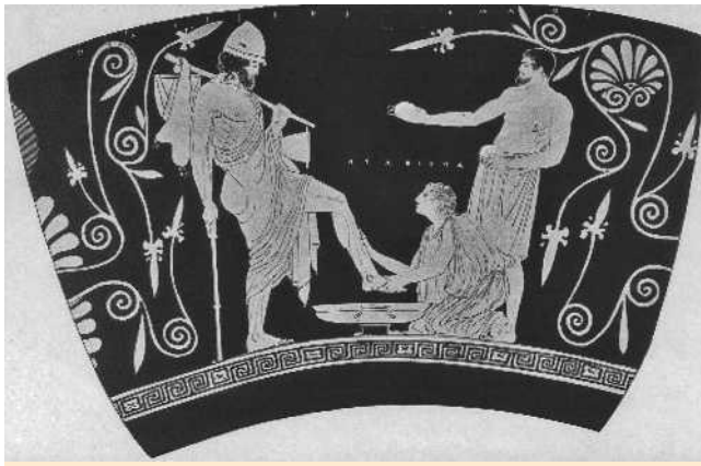
Abb. 1 Die Magd Erykleia erkennt Odysseus an seiner Narbe an der Wade. Attischer Skyphos, ca. 450 v. Chr.