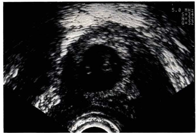
Abb. 2 Schwangerschaft (anamnestisch Ende 7./Anfang 8. Woche) im vaginalen Ultraschall. Deutlich differenzierbares Chorion (echodichter als die Uterusmuskulatur, mittlerer Außendurchmesser 37 mm, entspricht Stadium 14 bis 21/6 +3 bis 9 +3 SSW), mittlerer Chorioninnendurchmesser 25 mm (entspricht Stadium 16 bis 20/7 +2 bis 9 +2 SSW). GL 15 mm (entspricht Stadium 17 bis 19/7 +5 bis 9 +0 SSW), deutlich erkennbare obere und untere Extremitätenknospe (ab Stadium