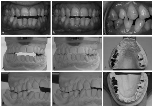
Abb. 5 a–i Instrumentelle Funktionsanalyse (54-jährige Patientin). a, d, g Manuell geführte Primärkontaktsituation im Mund und im Artikulator. b, c Maximale Interkuspidationsposition (habituelle Schlussbissposition) und Ventralverlagerung aus Primärkontaktsituation in habituelle Schlussbissposition. e, h Okklusaler Flächenschluss im Seitenzahnbereich nach Schleifkorrektur unter Beachtung der ursprünglichen Bisshöhe. f, i Schleifprotokoll – Flächenmarkierung

In Heft 1/07 der manuelletherapie sind im Beitrag von Dr. Elmar Ludwig Kraniomandibuläre Dysfunktion – Diagnostik und Therapie aus der Sicht des Zahnarztes, Teil 3: Zahnärztliche Therapiestrategien versehentlich die Abb. 5 und Abb. 7 bzw. deren Legenden durcheinander geraten. Nachfolgend sind die Abbildungen in der richtigen Reihenfolge mit den korrekten Legenden dargestellt.