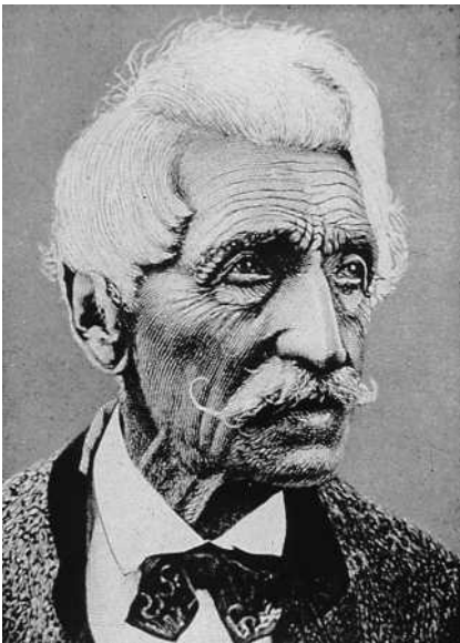
Abb. 1 Alte Haut mit feinen und groben, stehenden Falten im Gesicht; chronologische Alterung verstärkt durch Lichtalterung beim Pionier der Naturheilkunde und Sonnenenthusiasten Arnold Rikli (1823 – 1906).

nungslosigkeit, Enttäuschung, Trauer, Stumpfheit und Irrsinn. Das Alter selbst aber wird ganz besonders an Gesichtshaut und Haaren hervorragend beobachtet und als physiologischer Alterungsprozess äußerst präzise abgebildet. Die Verplumpung der Gesichtszüge mit tiefen, groben und feststehenden Falten einerseits und die dünne Altershaut mit feinen Fältelungen finden sich regelmäßig (◉ Abb. 1 ). Das Haupthaar schütter, weiß oder ergraut, passt dazu und alterstypische Hypertrichosen der Ohren, Augenbrauen und an den Wangen fehlen selten. Dies alles dient der sichtbaren und gradierten Darstellung des Alters an Haut und Haaren und wird entsprechend kombiniert mit alterskorrelierten körperlichen und seelischen Beeinträchtigungen. Die Altersveränderungen an Haut und Haaren stellen die obligaten, charakteristischen und typischen Merkmale des Alters in der bildhaften Wiedergabe dar, und sie werden in Schwere und Stärke des Ausdrucks so variiert, dass alle Stufen des Alterungsprozesses ausgedrückt werden können. Eher fakultativ und der besonderen Intention dienend, werden zusätzlich noch körperliche und seelische Besonderheiten beigelegt. So wird Alter in feinen Abstufungen der Schwere und der Komplexität bildhaft dargestellt. Diese Bemühungen lassen sich durch alle Epochen und Stilrichtungen verfolgen [1].