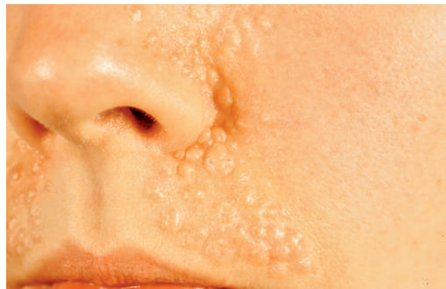
Abb. 2 Detailaufnahme.

Lippenregion als bevorzugte Lokalisation gelten [8]. Nur vereinzelt wurden solitäre Trichoepitheliome in anderen Bereichen am Integument beschrieben, z. B. an den Extremitäten, perianal oder an der Vulva [9–11]. Das klinische Bild solitärer Trichoepitheliome zeigt sich in Form hautfarbener Papeln oder Knoten von derber Konsistenz, die einen sehr unterschiedlichen Durchmesser aufweisen können. In den meisten Fällen handelt es sich um kleine, maximal 4–5 mm durchmessende, halbkugelige Papeln. Vereinzelt und dann typischerweise in extrafazialer Lokalisation finden sich auch größere, plaqueförmig erhabene oder plattenartig eingesunkene Tumoren, die in Einzelfällen einen Durchmesser von bis zu 9 cm erreicht haben. Diese großen Exemplare werden auch als Riesentrichoepitheliome bezeichnet [10–12]. Als eine weitere Sonderform der solitären Trichoepitheliome gelten die desmoplastischen Trichoepitheliome, die ebenfalls fast ausschließlich im Bereich des Gesichtes auftreten. Klinisch finden sich wenige Millimeter durchmessende, hautfarbene Papeln, die sich charakteristischerweise durch eine zentrale Atrophie und einen aufgeworfenen Rand auszeichnen [13]. Das Krankheitsbild der multiplen Trichoepitheliome manifestiert sich im Allgemeinen erstmals in der Kindheit oder der Adoleszenz. Bei zunächst kontinuierlicher oder schubweiser Zunah-