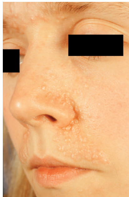
Abb. 1 Dicht stehende, teilweise konfluierende Trichoepitheliome zentrofazial.

Die Trichoepitheliome können aufgrund klinischer Befunde in zwei verschiedene Formen eingeteilt werden. Dabei lassen sich zunächst solitär auftretende von multiplen Trichoepitheliomen unterscheiden. Die solitären Trichoepitheliome, die häufiger als die multiplen Tumorformen beobachtet werden, entwickeln sich in der Regel im jungen Erwachsenenalter [7]. Sie treten sporadisch auf und lassen keinen Vererbungsmodus erkennen. Von wenigen Ausnahmen abgesehen, findet man solitäre Trichoepitheliome im Gesicht, wobei die Nase, die Wangen und die obere