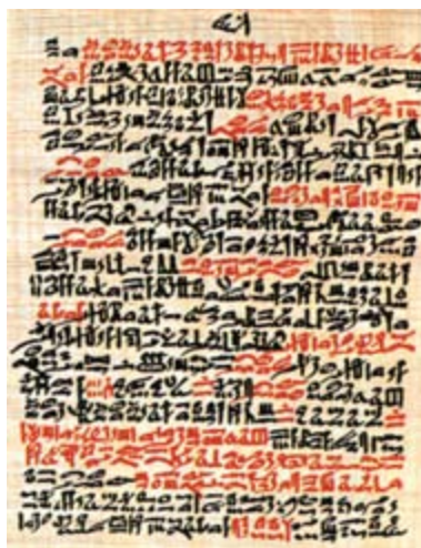
Aus dem Papyrus Ebers, des für die Pharmaziegeschichte bedeutsamsten ägyptischen Papyrus (1550 v. Chr.)

Die Entwicklung synthetischer Arzneistoffe gegen Ende des 19. Jahrhunderts schien die Arzneipflanze als Medikament zurückzudrängen. Heute sind jedoch 40–50% der in Apotheken verkauften Präparate pflanzlicher, mikrobieller und tierischer Herkunft. Oft haben auch Heilmittel aus der Retorte ihre Vorbilder in Naturstoffen (z.B. diente die Struktur des Morphins aus dem Opium als Modell für wichtige Schmerzmittel).