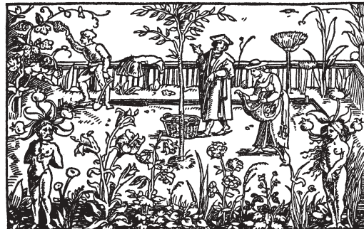
aus: Gart der Gesundheit, Antwerpen 1533 und 1547

Dass weltliche Herren im Bemühen, ihre Untertanen gut zu versorgen, der Kirche nicht nachstanden, zeigt die Landgüterordnung Kaiser Karls des Großen: das »Capitulare de villis«. Es wurde wohl im letzten Jahrzehnt des 8. Jahrhunderts für das gesamte Franken-