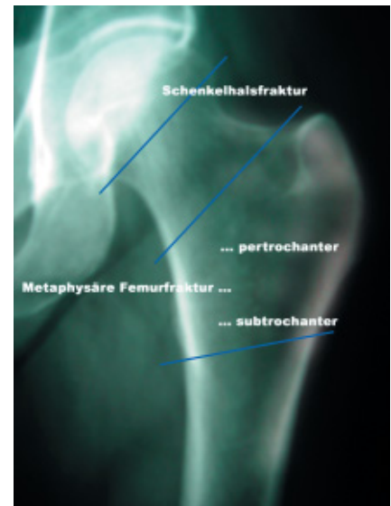
Abb. 1 Klinische Unterteilung der proximalen Femurfrakturen.

Zu definitiver Therapieplanung und Prognoseabschätzung auch frakturtypischer Komplikationen sind aber differenziertere Klassifikationen (AO-Klassifikation, Pauwels- oder Garden-Einteilung der Schenkelhalsfrakturen) notwendig.