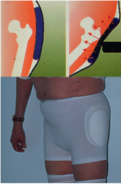
Abb. 4 Patient mit anliegendem Hüftprotector (Savehip®). Schematische Darstellung der Wirkungsweise. Stoßabsorption durch rutschfest eingearbeitetes Hartschalenpolster.

Bei einem Sturz treten bis 5-mal so hohe Energien auf als nötig sind, ein normales Femur zu brechen. Für die Frakturentstehung scheint deshalb vor allem das Ausmaß der Absorption der Sturzenergie durch umgebende Weichteile von Bedeutung zu sein. Spezielle Hüftprotectoren ( Abb. 4 ) sind in der Lage, diese Stoßabsorption zu gewährleisten und können das Frakturrisiko über 50% reduzieren [6, 7]. Zielgruppe sind vor allem hochgefährdete Patienten, z. B. in betreuten Einrichtungen, um die Restmobilität zu erhalten. Die schweizerische Bundesanstalt für Unfallverhütung kam in einer Kosteneffektivitätsanalyse bei Einsatz von Hüftprotectoren in Altenheimen auf jährlich ca. 35 Mio. SFr. Einsparpotential.