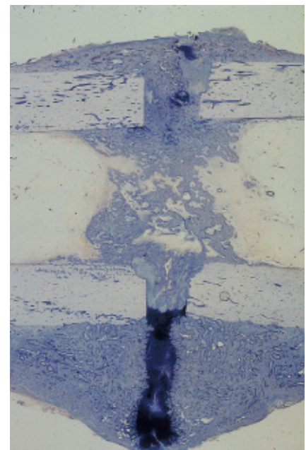
Abb. 3 Längsschnitt durch einen Schafsmetatarsus mit einem Frakturheilungskallus 9 Wochen p. o. (Färbung nach Paragon). Die Modellfraktur (Osteotomie) wurde flexibel stabilisiert (interfragmentäre Bewegung ca. 0,5 mm). Die größere interfragmentäre Bewegung stimuliert eine größere Kallusbildung vor allem auf der dem Fixateur abgewandten Seite und eine stärker ausgeprägte enchondrale Ossifikation.