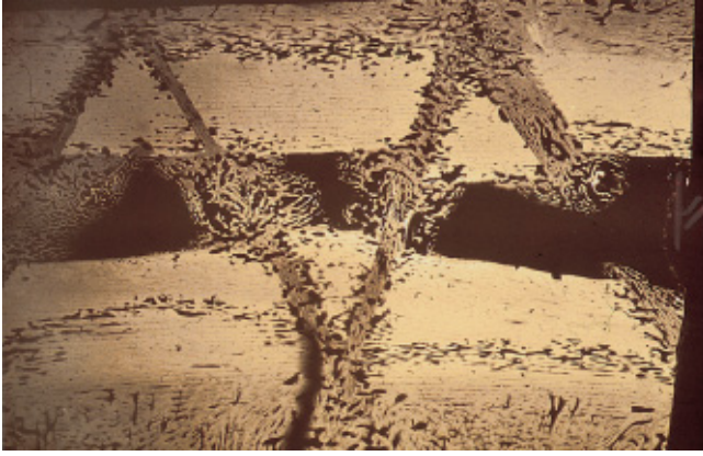
Abb. 4 Mikroradiografie einer Mehrfragmentmodellfraktur mit drei freien Fragmenten. Die freien Fragmente wurden nicht stabilisiert. Ein überbrückender Fixateur externe stabilisierte die beiden Hauptfragmente. Zwölf Wochen p. o. waren die Fragmente mit Kallus überbrückt und die Osteotomiespalten mit Geflechtknochen aufgefüllt.

sind damit besser tolerierbar für die Knochenneubildung. Ein experimentelles Beispiel für eine solche Situation ist die Stabilisierung einer Modellfraktur mit drei freien Fragmenten, die sowohl mit einem steifen Fixateur externe als auch mit einer Überbrückungsplatte gut ausgeheilt sind [2]. Die Fragmente zeigen im tierexperimentellen Modell am Schaf nach 12 Wochen eine Kallusüberbrückung der Fragmente und eine Auffüllung der Frakturspalten mit Geflechtknochen ( Abb. 4 ). Wie beim „Plattenfixateur interne“ haben diese beiden Stabilisationsverfahren gegenüber der konventionellen Technik mit stabiler Fixation aller Fragmente, durch interfragmentäre Kompression und Plattenanpressung, den Vorteil der geringeren biologischen Beeinträchtigung des Heilungsgebietes.