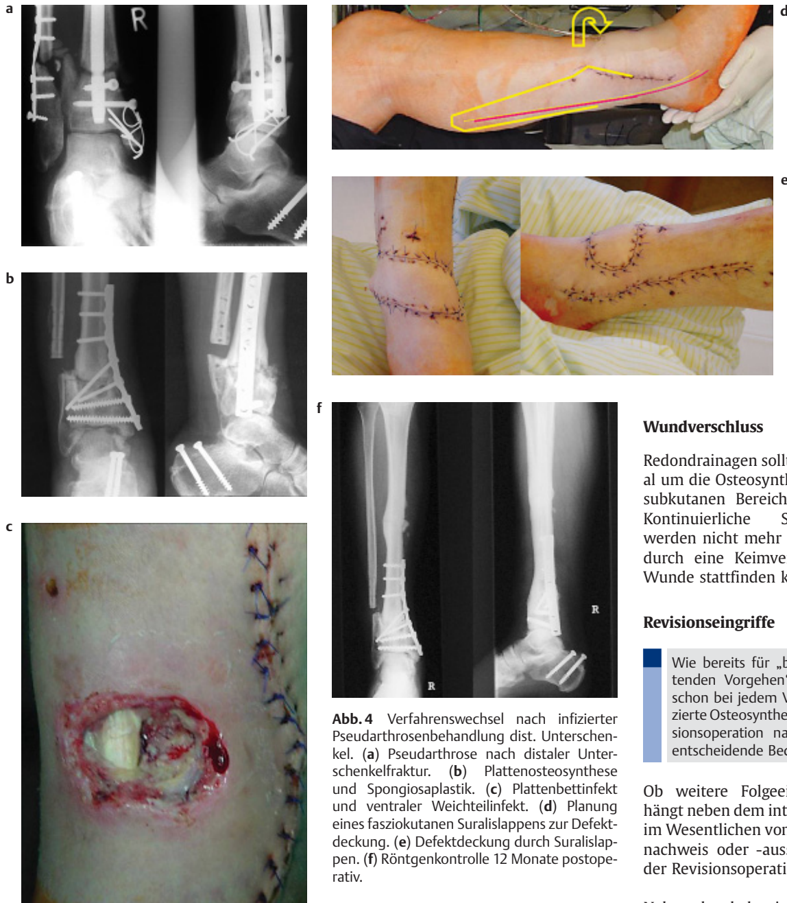
Abb. 4 Verfahrenswechsel nach infizierter Pseudarthrose nach distaler Unterschenkel. (a) Pseudarthrose nach distaler Unterschenkel. (b) Plattenosteosynthese und Spongiosoplastik. (c) Plattenbettinfekt und ventraler Weichteilinfekt. (d) Planung eines fasciokutanen Suralislappens zur Defektdeckung. (e) Defektdeckung durch Suralislappen. (f) Röntgenkontrolle 12 Monate postoperativ.