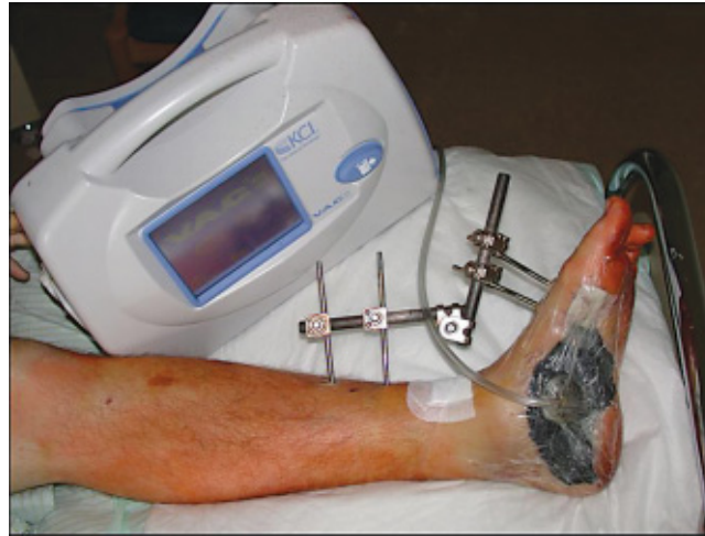
Abb. 3 Vakuumversiegelung.

gen, dass das primäre Ziel der Behandlung einer akuten postoperativen Implantatinfektion sein muss, die Infektsanierung zu erreichen, ohne damit eine chronische Osteitis zu verursachen. Hierbei hat sich das Operationskonzept bewährt, beim Entschluss zum Erhalt der Osteosynthese prinzipiell einen „second look“ nach 2–3 Tagen durchzuführen. Dabei gelten für das subtile Debridement, die Spülung und Abstrich sowie Gewebeprobe dieselben Kriterien wie beim ersten Eingriff. Das Ziel, ein infektfreier Erhalt der Osteosynthese, wird dabei definitionsgemäß dann erreicht, wenn bei drei aufeinander folgenden operativen Revisionen Abstriche und Gewebeprobe ohne Keimnachweis sind. Im Falle von weiter bestehender Kontamination nach 4 operativen Revisionen sollte das Osteosynthesematerial entfernt werden. Mit diesem Revisionskonzept konnten in einer prospektiven Studie mit Frühinfektion nach Osteosynthese 32% der Implantate erhalten werden [11].