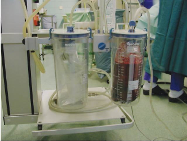
Abb. 4 Beispiel für Sekretaufangbehälter. Zwischen den Behältern kann schnell gewechselt werden.

Zylinder-Systemen erzeugt wird. Je nach Indikation wird mit Unterdrücken von bis zu ca. – 700 mmHg gearbeitet. Dabei können bis zu 50 Liter Luft pro Minute angesaugt werden. Typischerweise werden die Sekrete im OP in Kunststoffbeuteln aufgefangen, die von außen dem Unterdruck ausgesetzt sind und ein Ventil haben, durch das die zunächst enthaltene Luft entweichen kann, welches aber gleichzeitig einen Schutz vor Überlaufen darstellt und mit einem Bakterienfilter versehen ist. Um einen reibungslosen Betrieb zu gewährleisten, sollten wenigstens zwei Systeme parallel vorhanden sein; dann kann, nachdem ein Beutel gefüllt ist, schnell auf den anderen gewechselt werden (s. Abb. 4 ). In den Beuteln können Substanzen vorhanden sein, die das abgesaugte Sekret in einen gelartigen Zustand überführen und so ein hygienisches Entsorgen erleichtern.