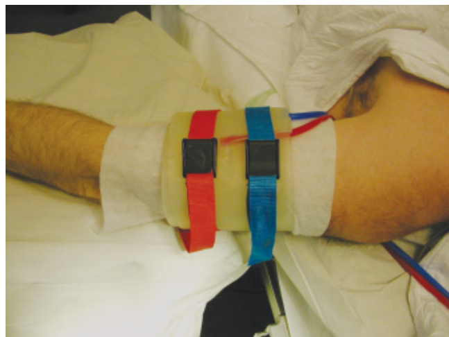
Abb. 5 Unterpolstern der Druckmanschette mit einer dünnen (!) Lage Verbandswatte.

Blutsperren können zu verschiedenen ernsthaften Komplikationen führen, die sich bei sachgerechter Anwendung fast immer vermeiden lassen.