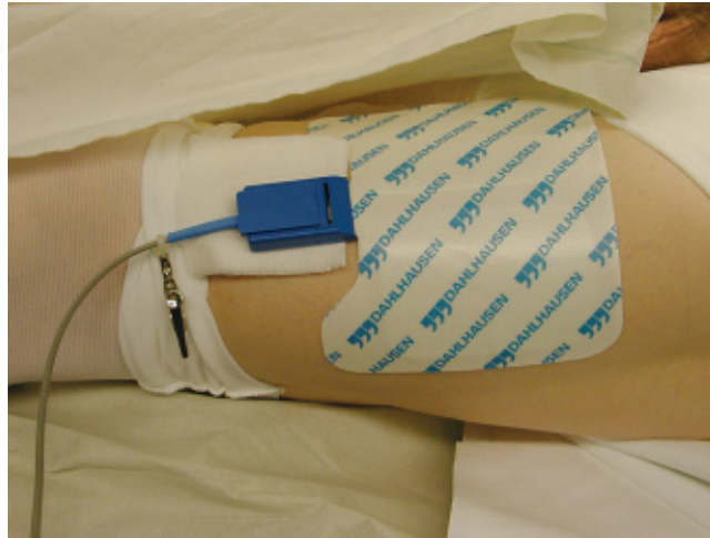
Abb. 1 Typische Platzierung der Neutralelektrode am Oberschenkel; großflächige Elektrode, Haut rasiert.

trisch leitet und eine Verbindung zwischen Patient und z. B. dem OP-Tisch herstellen kann, über die dann unerwünschte Ströme fließen können.