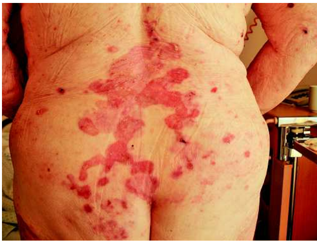
Abb. 1 Dermatohistopathologie: Subepidermale Blasenbildung mit Abhebung der unveränderten Epidermis.