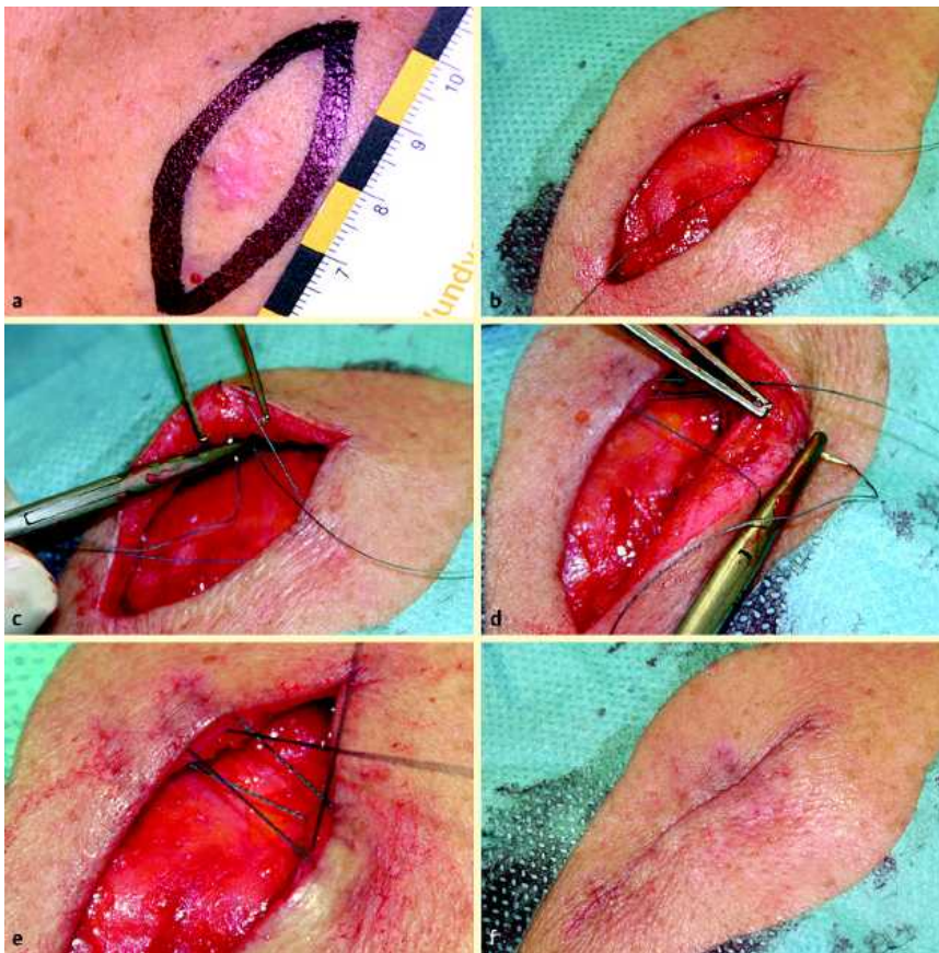
Abb. 2 Dehnungsplastik zum Verschluss eines einfachen Exzisionsdefektes mithilfe der corialen Flaschenzugnaht. a Superfiziellles Basaliom am rechten Schulterblatt, eingezeichnete spindelförmige Schnittführung zur Exzision mit 2 mm Sicherheitsabstand. b Exzisionsdefekt. Die erste horizontale Schleife ist bereits wie für eine vertikale coriale Einzelknopfnah erfolgt (Faden: Terylene® 2-0, zur Demonstration, für endgültigen Verschluss wurde 2-0 Serafit® verwendet). c Die zweite Schleife erfolgt parallel zur ersten: Einstich von unten. d Zweiter Teil der 2. Schleife: Einstich von oben, Ausstich zentral unten (Pinzette). e Fadenführung in Form einer Acht. Der Knoten kommt zentral zu liegen. f Die Wunde wurde durch 3 coriale Flaschenzugnähte vollständig verschlossen. Eine Hautnaht ist nicht notwendig.