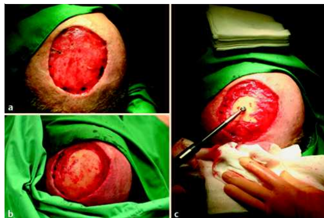
Abb. 3 Exzision des Tumors mittels Schnellschnitt mit 3 cm Sicherheitsabstand bis zur Muskelfaszie im Gesunden (a) und Fräsung der Kalotte (b, c).

ca. 9 Monate nach der Operation ein, sodass wir auf eine Hauttransplantation verzichtet haben (● Abb. 1 b ). 24 Monate postoperativ zeigte sich kein Lokalrezidiv, und in der Durchuntersuchung ergab sich kein Nachweis von Metastasen.