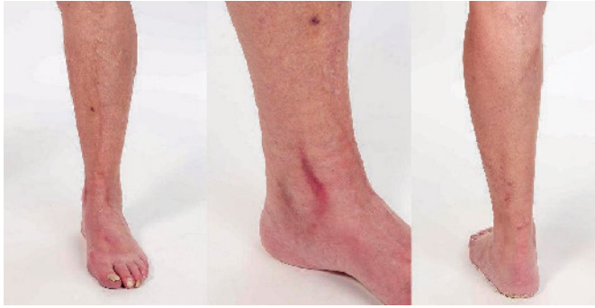
Abb. 1 Im Bereich des distalen Unterschenkels sowie des linken Vorfußes zeigen sich drei teils gabelartige erythematöse, überwärmte, strangförmige Verhärtungen.

ner GFR von 15,2 ml/min auf. Duplexsonografisch zeigte sich eine tiefe Beinvenenthrombose der V. poplitea links und der Äste der Vv. peroneae, Vv. gastrocnemii und Vv. soleii links sowie zusätzlich eine langstreckige Thrombophlebitis der V. saphena magna links ab unterhalb des Kniebereiches bis zum Fußrücken.