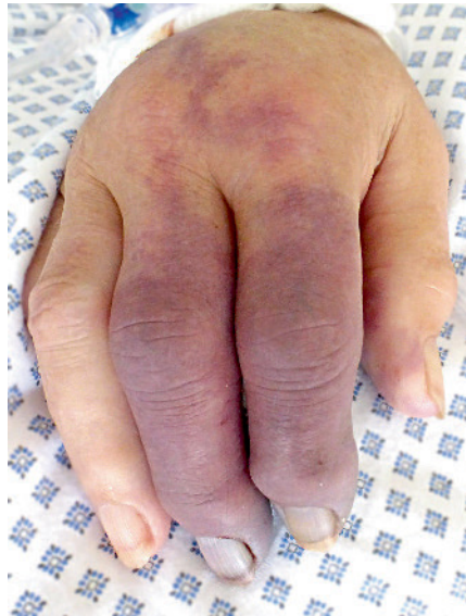
Abb. 3 Im Bereich der rechten oberen Extremität zeigen sich livid-hämorrhagische scharf begrenzte Makula. Die rechte Hand ist ödematös geschwollen. Rekapillarisierung ist im Bereich des DII und DIII rechts nicht vorhanden.

Die Erklärung der Pathogenese der hämostaseologischen Veränderungen bei Tumorpatienten ist komplex, offensichtlich multifaktoriell und bis heute nicht abschließend geklärt (7, 8). Neben klassischen Ursachen wie Patientenalter, Immobilität, assoziierten Therapien wie Chemotherapien, Bestrahlungen oder tumorbedingten Gefäßkompressionen bzw. -infiltrationen, werden erworbene tumorassoziierte Thrombophilien durch Bildung von tissue-factor, cancer procoagulant (CP), Zytokinen und TNF diskutiert (9). Bei muzinösen Adenokarzinomen konnten außerdem Glykoproteine identifiziert werden, welche den Faktor X aktivieren (10). Dies stellt eine mögliche Erklärung für die vergleichsweise häufige Thromboseneigung bei Patienten mit Adenokarzinomen dar (11). Für die Routinediagnostik stehen die