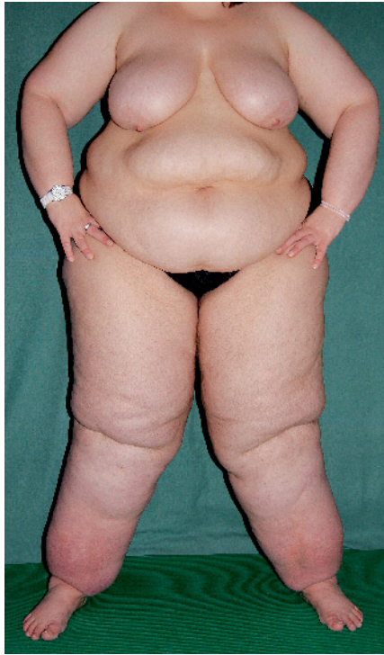
Abb. 5 Patientin, die über Jahre wegen eines Lipödems ambulant behandelt wurde.

Der Terminus „Lipolymphödem“ sollte daher aus dem lymphologischen Sprachgebrauch getilgt werden. Er sollte auch deshalb getilgt werden, weil er häufig missbraucht wird, um die von Lipödempatientinnen meist begehrte Manuelle Lymphdrainage rezeptieren zu können. Dass dieser Missbrauch auch von offizieller Seite gefördert wird, erinnert schon stark an ein Possenstück. Die Manuelle Lymphdrainage wird im Heilmittelkatalog – zu Recht – nicht als Indikation für das Lipödem aufgeführt. Dies macht medizinisch Sinn, da die Evidenz für ein relevantes Ödem (Ödem im Sinne von Flüssigkeit) beim Lipödem komplett fehlt. (Dieser Punkt ist Thema von Teil 2 dieser Darstellung). Diese -medizinisch vernünftige – Entscheidung wird allerdings in einem gemeinsamen Fragen- und Antworten-Katalog der Spitzenverbände der Krankenkassen und der Kassenärztlichen Bundesvereinigung (KBV) durch folgende Formulierung ad absurdum