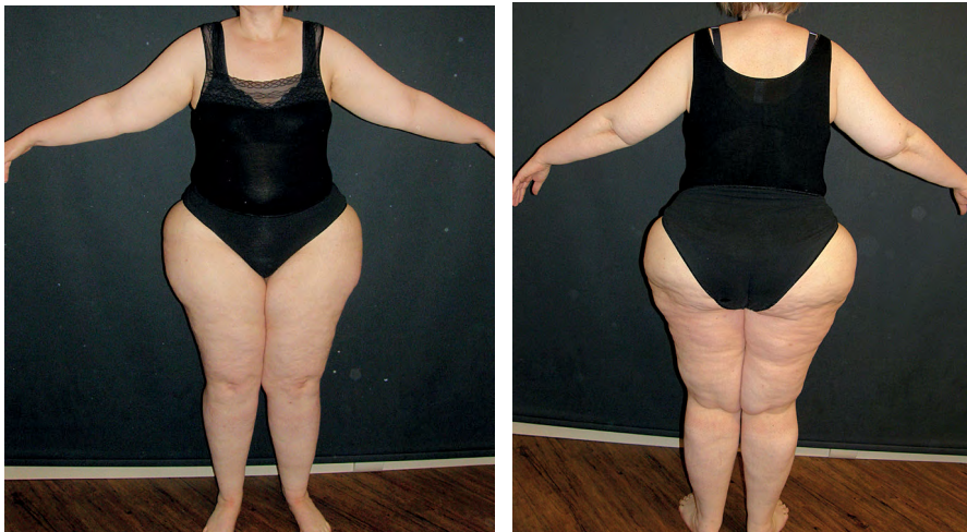
Abb. 6 Fallbeispiel Lipödem: Gewichtsabnahme; 104 kg (-36,5 kg) Umfangsabnahmen von 10–18 cm: Immer noch massive Lipohypertrophie. Keine Beschwerden, kein Lymphödem mehr.

Fallbeispiel Lipödem: Lipödem Stad II; Gewicht 141 kg; 178 cm; BMI 44,5; Keto-gene proteinreiche Ernährung; Symptom-besserung bereits nach 1 Woche (sub- jektiv und objektiv durch Lymphthera- peuten)