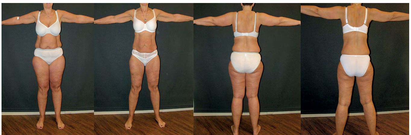
Abb. 4 Fallbeispiel Lipödem: Adipositas Grad I (BMI 31,1), 91,2kg; WHtR 0,55; Lipödem der Arme (Stad I) und Beine (Stad II); Berührungsempfindlichkeit, Spontanschmerzen, 3–4 Ibu 400/Tag; früherberentet „wegen ihrer Beine und der Schmerzen“; Rheumatologie und Muskelbiopsie opB; HOMA-IR 1,3;

onsrisiko gehören hierzu langfristig Fehlor- oder Mangelernährung, Osteoporose, Ösophagitis, Dumping-Syndrom und Blutzuckerschwankungen bei Diabetes, erhöhte Suizid- und Unfallraten im Vergleich zu Nichtoperierten, erhöhter Drogenkonsum, sowie eine Rate von bis zu 20% Therapieversager (62–64). Eine langfristige Nachsorge und Betreuung ist sowohl nach Adipositaschirurgie als auch nach Ernährungstherapie zwingend erforderlich, nur dann sind zufriedenstellende Langzeitergebnisse möglich (65).