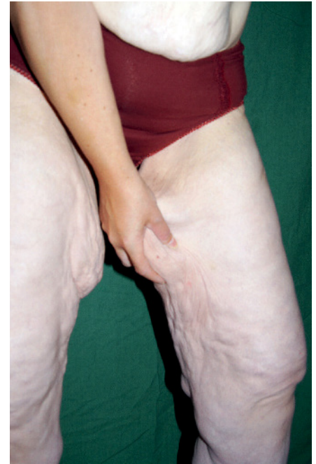
Abb. 7 Patientin aus Abb. 5, ein Jahr später. Überschüssige Haut mit Unterhautfettgewebe

beschwerdefrei. Wir sprechen dann von einem Lipödem in Remission.