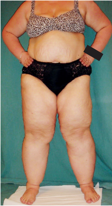
Abb. 1 Lipödempatientin (Gewicht 122 kg, Größe 168 cm, BMI 43 kg/m 2 ) vor Schlauchmagenoperation. Das Beinvolumen beträgt hier je Bein 19 Liter)