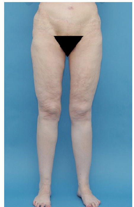
Abb. 9 Nach Gewichtsstabilisierung von knapp 1 Jahr erfolgte eine Straffung der den Genitalbereich überlagernden Bauchschürze und eine Oberschenkelstraffung durch plastischen Chirurgen