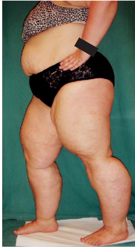
Abb. 2 Lipödempatientin (Gewicht 122 kg, Größe 168 cm, BMI 43 kg/m 2 ) vor Schlauchmagenoperation. Das Beinvolumen beträgt hier je Bein 19 Liter)