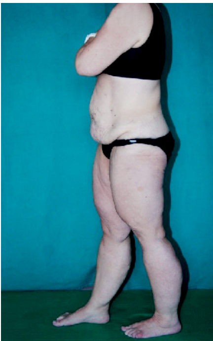
Abb. 3 Patientin aus Abb. 1 und 2, 11 Monate nach erfolgter bariatrischer OP. Das Gewicht betrug jetzt 74 kg, der BMI lag bei 26 kg/m 2 .