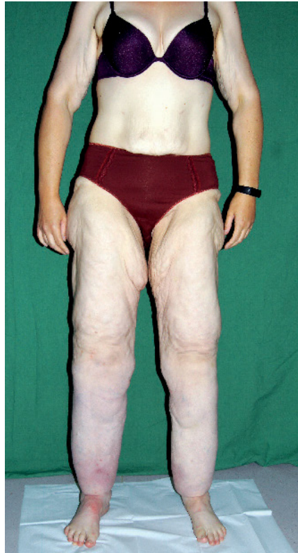
Abb. 6 Patientin aus Abb. 5, ein Jahr später, nach Magenbypass-OP