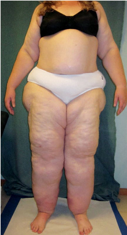
Abb. 5 Patientin mit Lipödem und inzwischen auch distal betontem Beinlymphödem